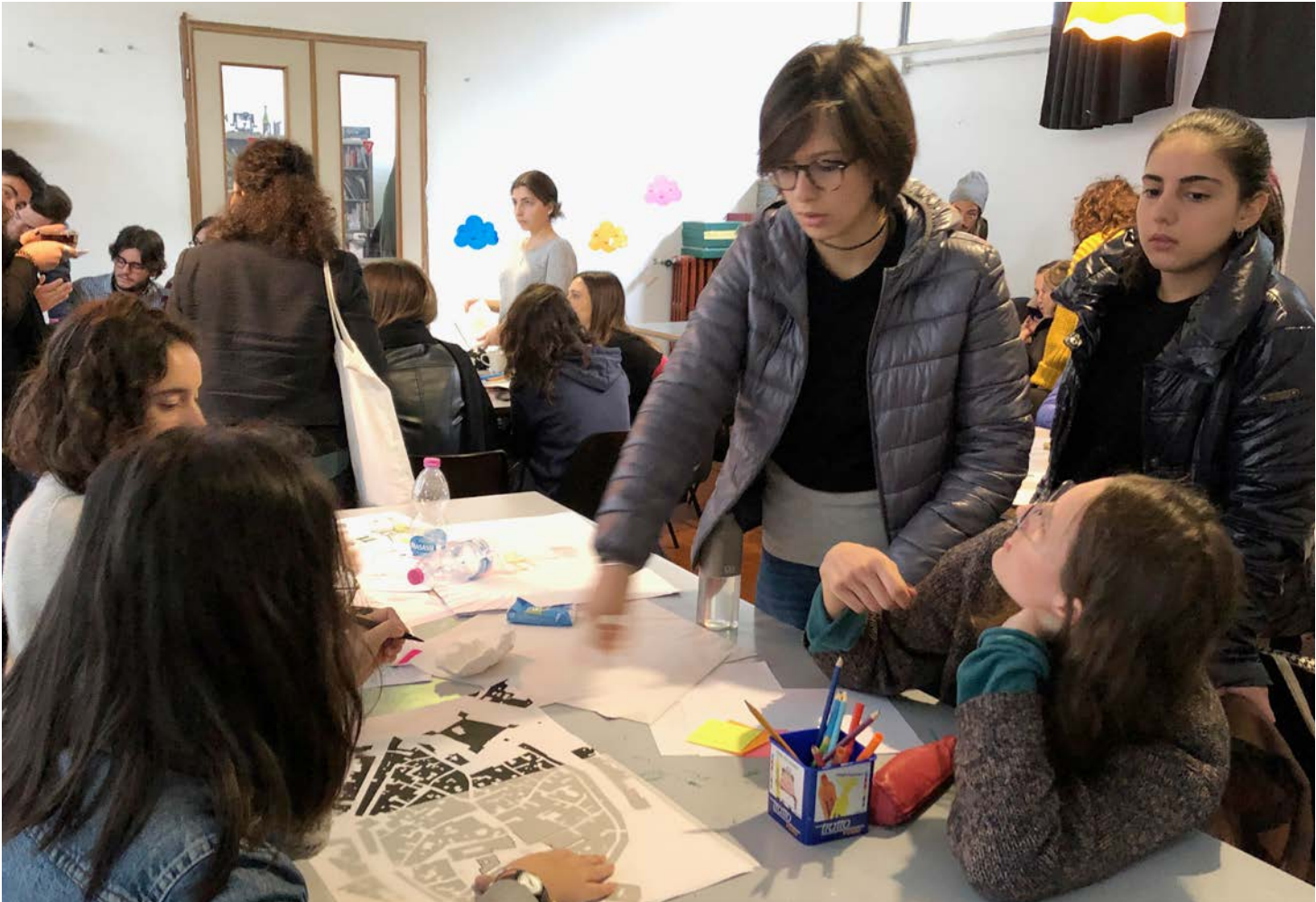
TRAVAIL AVEC LES ÉTUDIANTS NAPOLITAINS LORS DU WORKSHOP "SHUFFLE PARASITE"