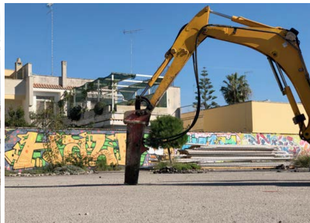
Végétalisation du parking des Manifatture Knos à l'occasion du workshop "Asfalto mon amour"

et commence à marteler le bitume pour mettre au jour la terre tapie sous ces cinq centimètres. L'action prit alors une nouvelle tournure, faite d'expérimentations asphalto-végétales. L'usine exerce son aura et invite à exploiter la brutalité des matériaux : bitume, grillage, ferrailages et bois. Notre groupe a débarqué, six ans après le déclenchement, dans un laboratoire de paysage et de design à ciel ouvert. Une immense dalle goudronnée clairsemée d'espaces plantés et de mobilier urbain. Nous avons rejoint l'équipe à l'œuvre et cherché, percé, pioché, pelleté, transporté et planté. Le pépiniériste voisin est ami du collectif et nous avons grâce