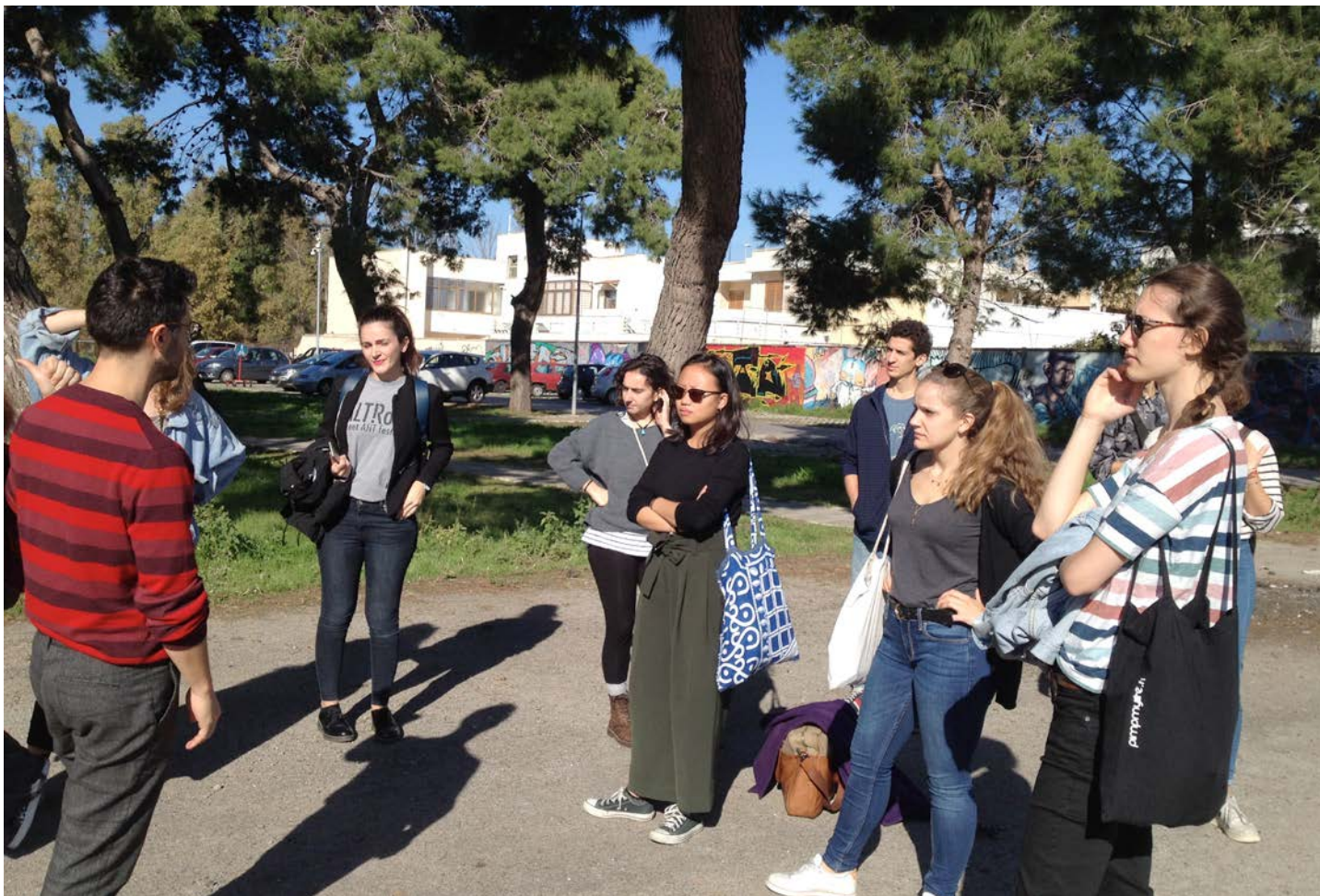
PRÉSENTATION DES OBJECTIFS ET DU TERRAIN DU WORKSHOP "ASFALTO MON AMOUR"