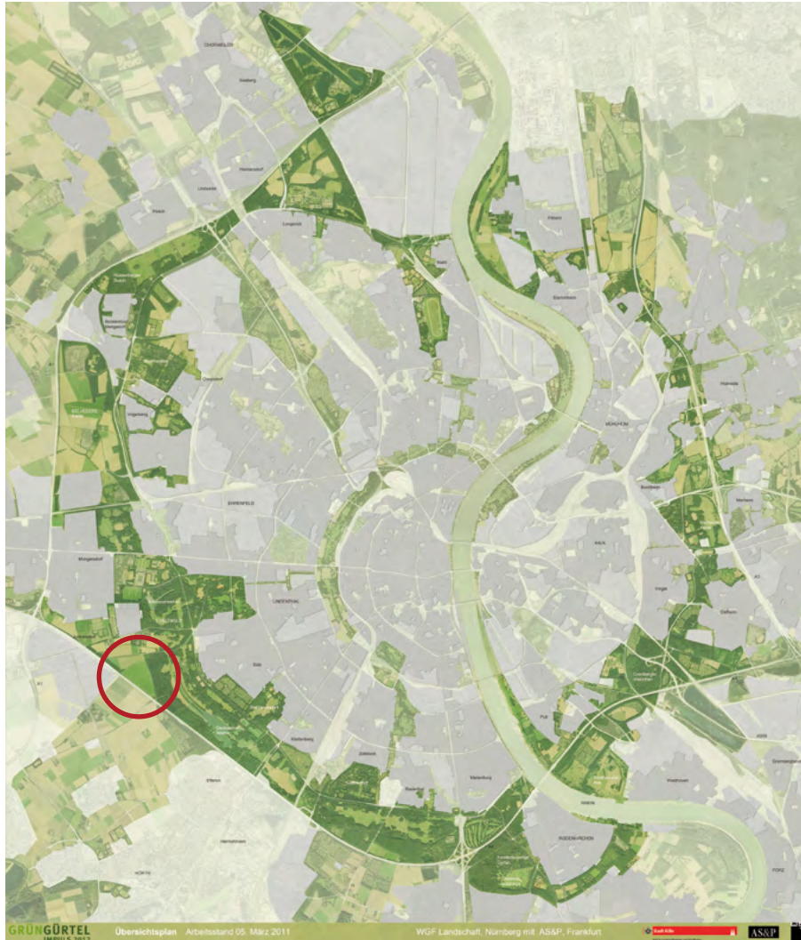
Waldlabor Köln: design and its 4 parts